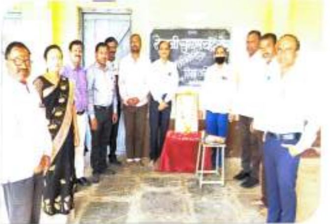
मराठी सुभाषचंद्र बोस जयंती साजरी करताना प्राध्यापक तथा शिक्षक संकलन