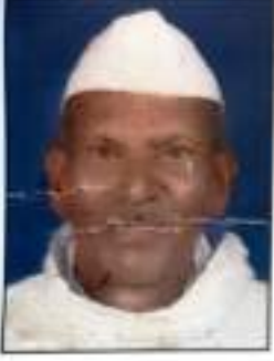
श्री भाऊरावकाका महल्ले शेलू खुर्द