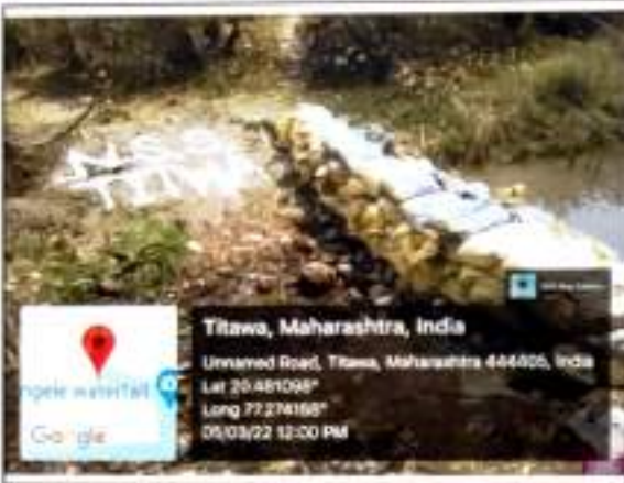
शिबीगर्ध्यांच्या श्रमदानातून निर्मित रा.से.यो. चम्पू ने बांधलेला बांधाग