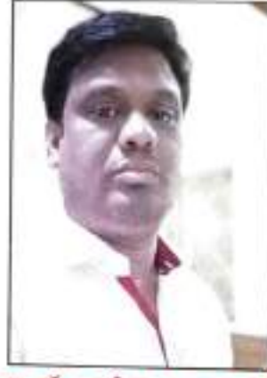
प्रा. डॉ. पुरुषोत्तम रामराव वान्ते जिजामाता आर्ट्स कॉलेज, दारव्हा