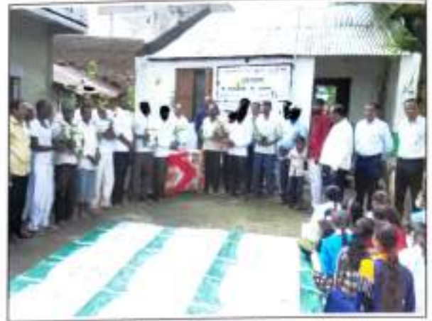
भेंडीपहाला येथे वसुंधरा दिना निमित्त वृक्ष रोपे देतांना राष्ट्रीय सेवा योजनेची चम्पू व प्राध्यापक