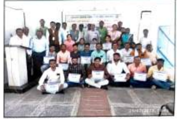
महाविद्यालयात दि. २५ फेब्रुवारी २०२३ रोजी आयोजित माजी विद्यार्थी मेळाव्यातील सुखद क्षणचित्र