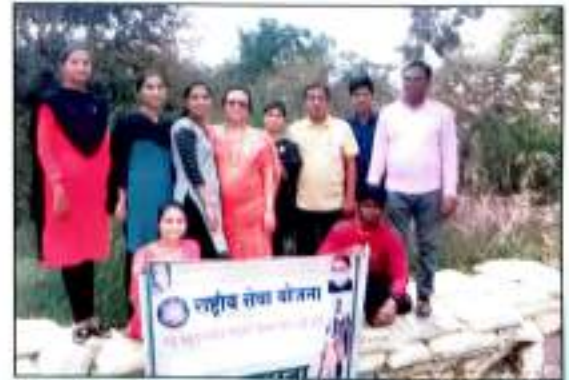
राष्ट्रीय सेवा योजने तर्फे स्वयंसेवकांनी शिबीरा दरम्यान भ्रमदानातून बांधलेला बंधारा