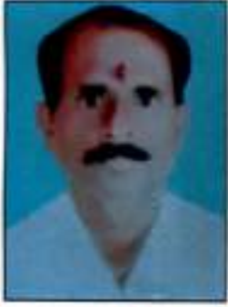
श्री गणेशरावजी महल्ले शेलू खुर्द