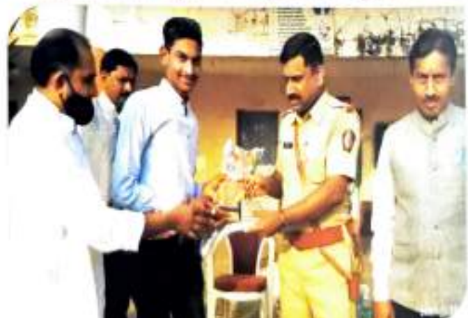
विद्यालयीय वारिशांक वितरण करताना प्राचार्य तथा पोलीस अधीक्षक