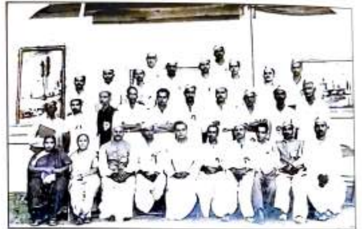
भारतीय जनसंघ महाराष्ट्र प्रदेश अधिवेशनात स्व. भाऊसाहेब