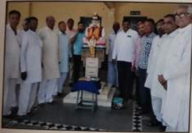
महाविद्यालयाने सदिच्छा भेट देतांना मानवविकास संसाधन राज्यमंत्री ना. संजयभाऊ धोत्रे