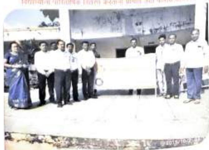
विद्यालयीय वारिशांक वितरण करताना प्राचार्य तथा पोलीस अधीक्षक