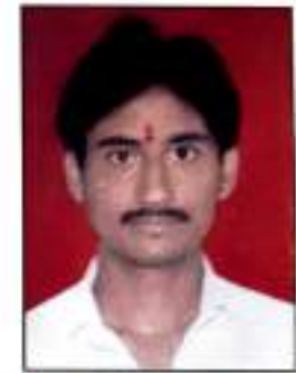
शि. अंकुशजी महल्ले शेलू खुर्द