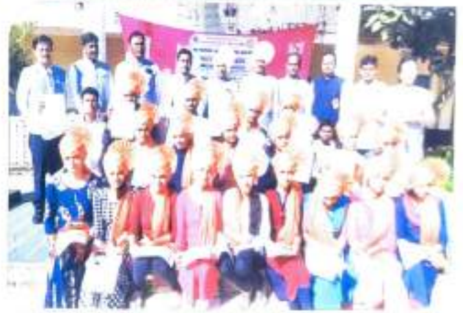
धंदवी पाम केलेल्या विद्यार्थ्यांचा साकार संस्कार