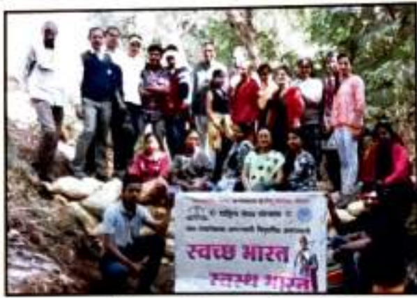
टसकड्याम भेंडीमहाला येथील श्रमसंस्कार शिबीरातील विद्यार्थ्यांनी बांधलेला बांधारा.