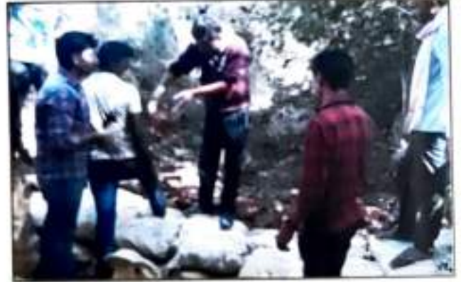
मातीबंधारा बांधताना (रा.से.यो.) भेंडीमहाला येथे राहभाजी