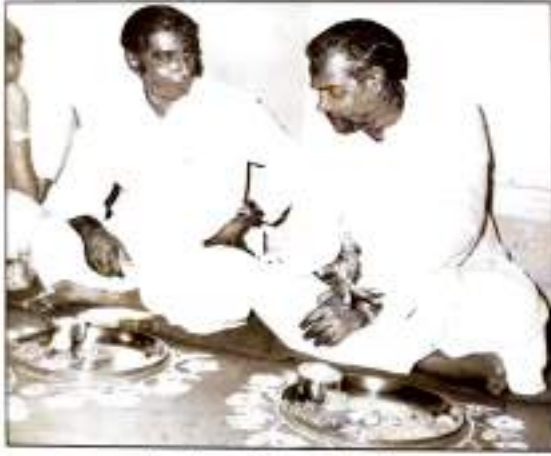
मा. अटलबिहारी वाजपेयीसह स्नेहभोजन करतांना