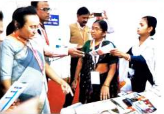
सुभाषचंद्र बोस जयंतीस ग्रंथ प्रदर्शनीस ग्रंथ निरिक्षण करताना