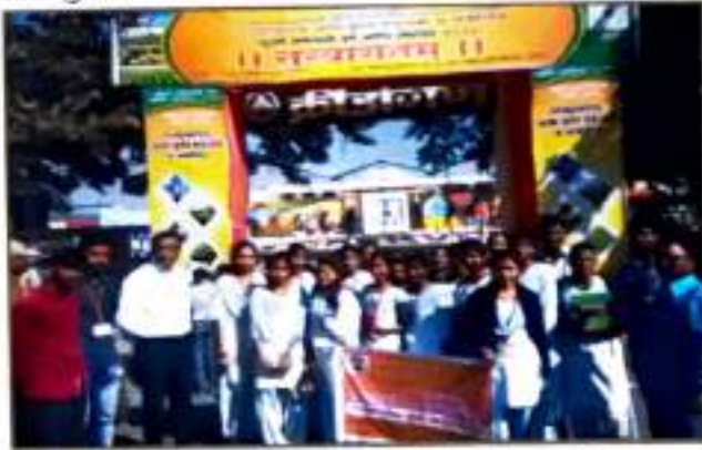
कृषी प्रदर्शनास (डॉ. पंजाबराव देशमुख कृषी विद्यापीठ, अकोला) भेट दि. २९ डिसेंबर २०१८