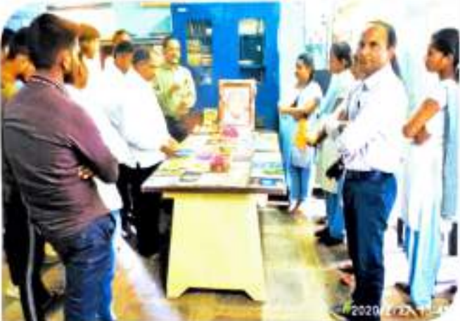
मराठी भाषा साहित्यिका निमित्त मराठी ग्रंथ प्रदर्शनीस ग्रंथारी साहित्यी संकलन करताना विद्यार्थी