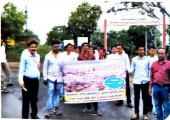
सांगली,कालहापुरे पुरग्रामांना महाविद्यालयातर्फे मदत निधी संकलन