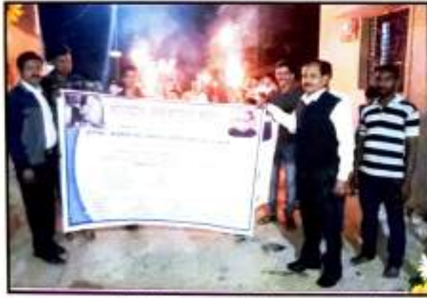
ग्राम खेडा येथे दि. २९ नोव्हेंबर २०१८ रोजी संविधान जनजागृती कार्यक्रमाची मशाल रॅली